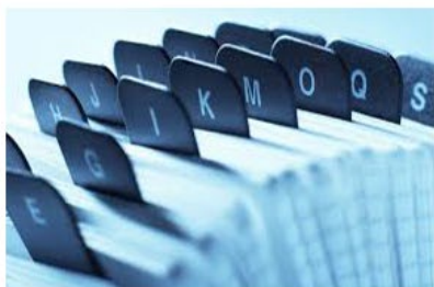
Ver datos de Empresa